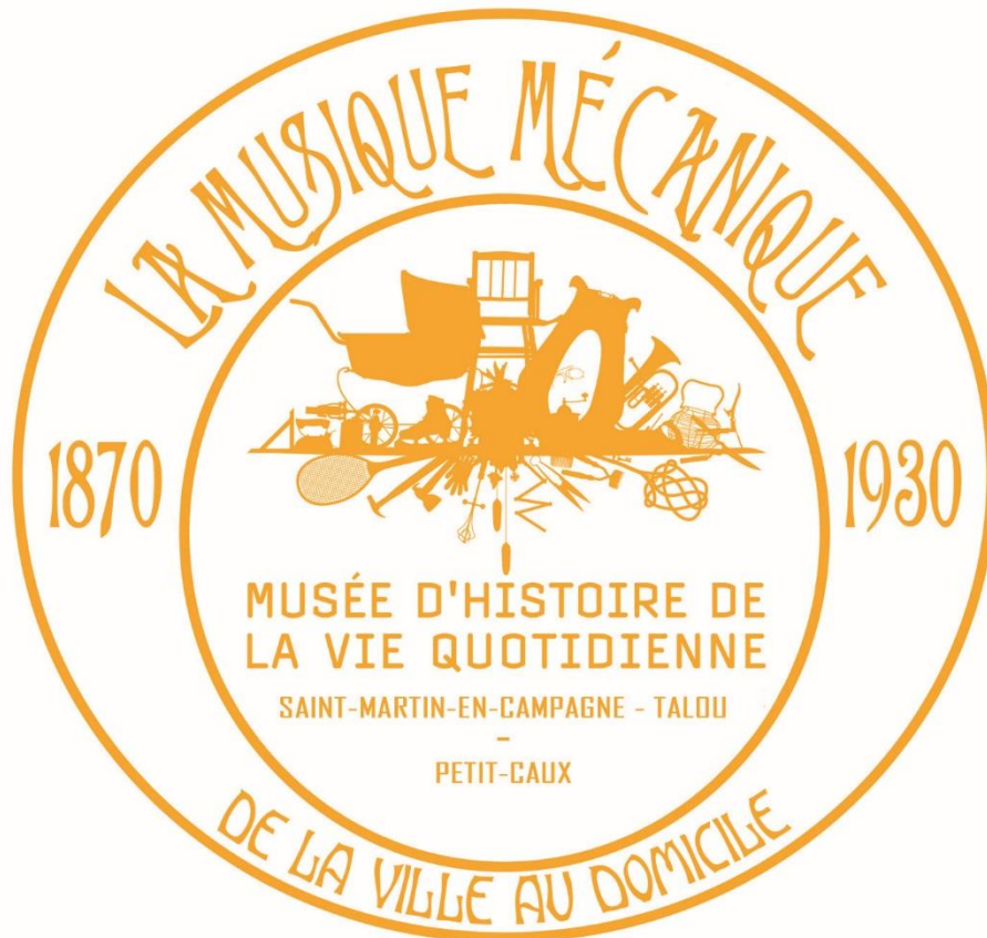
Figure 5 Visuel pour l'exposition avant l'affiche