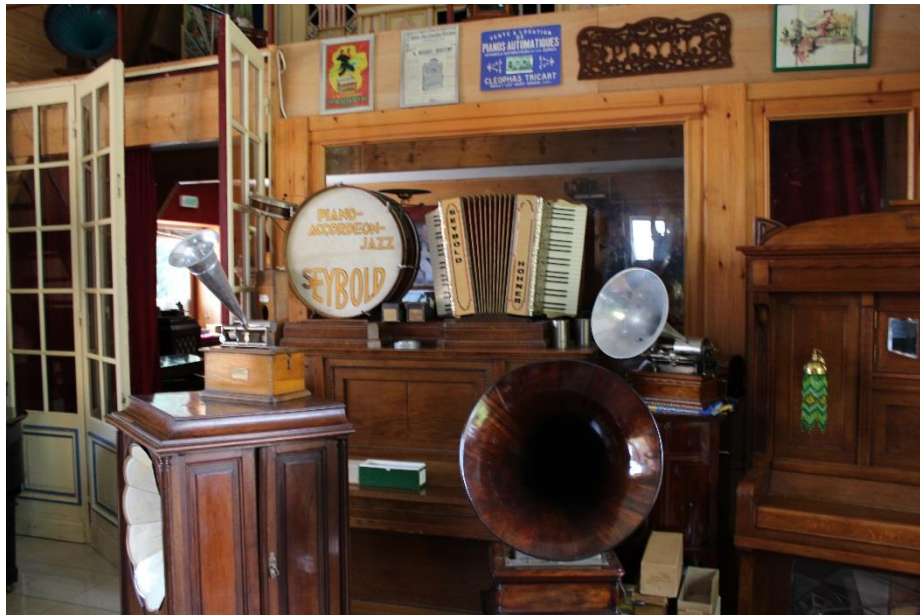
Figure 3 Photographie prise à la Ferme des Orgues de Steenwerck

Le quatrième pôle est quant à lui consacré aux instruments que l'on pouvait trouver chez soi, il y aura le piano à antiphonel présenté avec des valises de planchettes, la serinette, premier véritable instrument mécanique de salon avec sa cage à oiseaux et les boîtes à musique, instruments de musique mécanique les plus répandus sans doute. Ce pôle sera notamment décoré par un tableau musical venu de Musée de l'Horlogerie ainsi que par divers éléments contextuels comme une horloge ou une robe du début du XX e siècle etc.