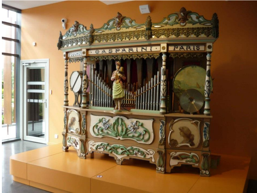
Figure 4 Orgue de foire Gasparini