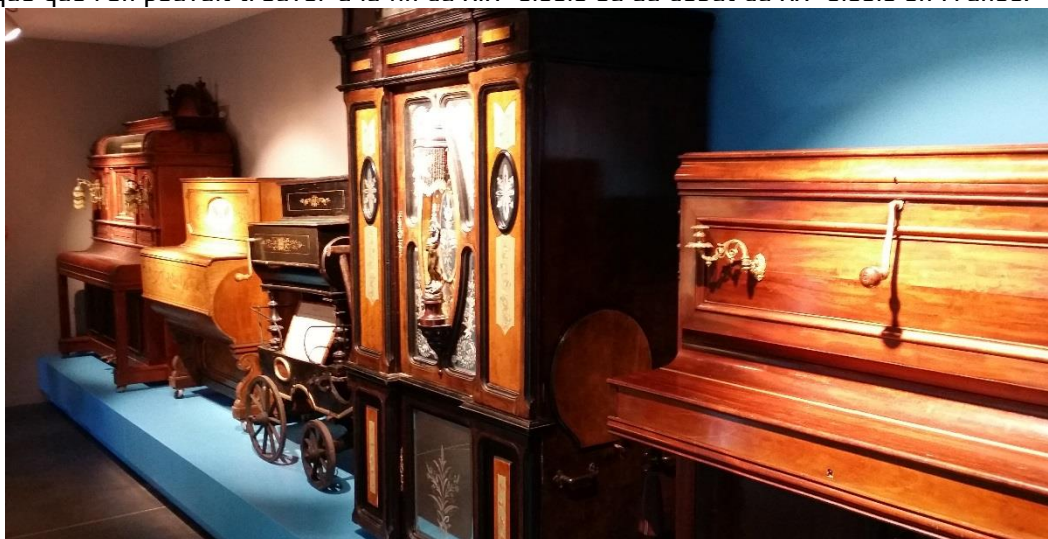
Figure 1 Instruments actuellement en exposition au musée